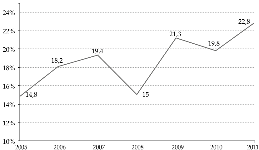
Figura 1: Personas que se han declarado víctimas del crimen en perspectiva comparada

Otro tema que marcó el 2011 en El Salvador fue el nivel de violencia. El número de homicidios de 2011 ha sido el segundo más alto en una década, sólo superado por el 2009, un año electoral, cargado de simbolismo, que vio triunfar al primer gobierno de izquierda en las elecciones presidenciales. Así también lo han señalado los salvadoreños que han declarado en un 65% que el principal problema del país ha sido la violencia, la